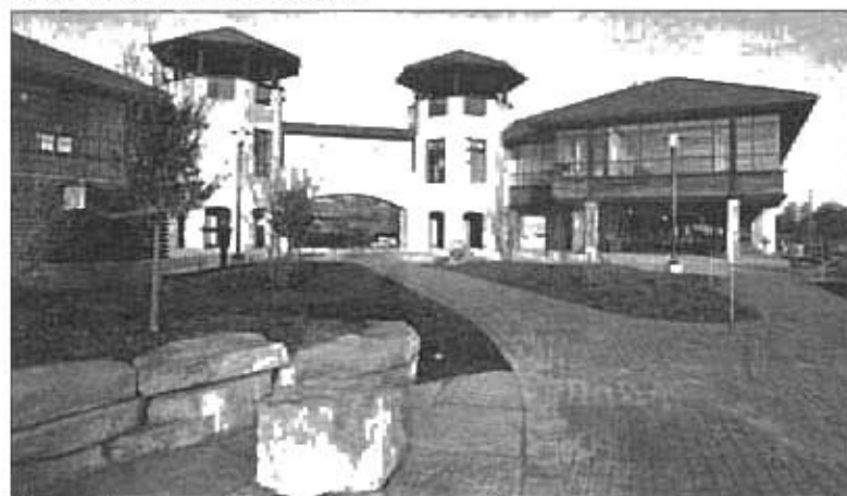
„Promega Corporation“, Madison, WI