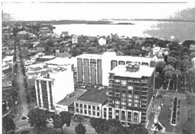
Madisono ir Mendota ežerų vaizdas nuo Wisconsin Kapitolijaus

Pasaulinėje pienininkystės parodoje kasmet apsilanko per 65 000 lankytojų iš daugiau negu šimto pasaulio šalių ir keli šimtai kompanijų pristato savo gaminius. Kasmetinėje parodoje vyksta įvairių kompanijų naujų produktų pristatymai, paskaitos, pranešimai, susitikimai. Taigi dienos WDE dalyviams buvo turiningos ir labai užimtos. Specialistai iš Lietuvos linke penininkystei pristatytus, susitiko su